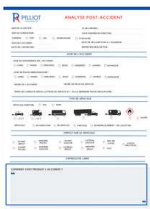
MISES EN SITUATION

LES PARTICIPANTS SONT INVITÉS À VENIR AVEC DES CAS REELS D'ACCIDENTS. LE CONTENU THÉORIQUE EST ABORDÉ AU FUR ET À MESURE DES MISES EN SITUATION.